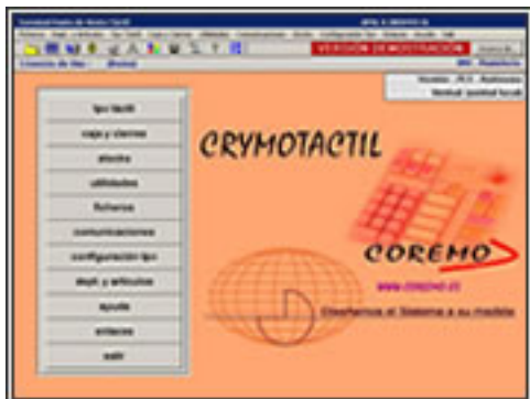
Programa para TPV Táctil

Es un conjunto de programas de gestión y venta creados y desarrollados para optimizar y maximizar los recursos de la tecnología táctil y con la gestión efectuada desde teclado.